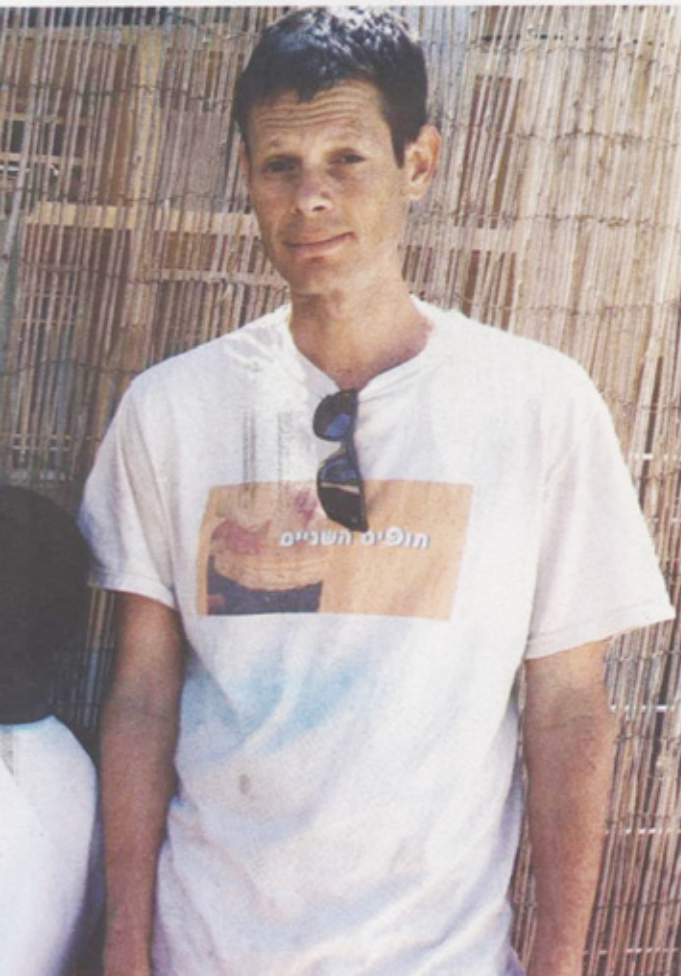
בני משפחת כוכב, החשש התמוגג בשנייה הראשונה