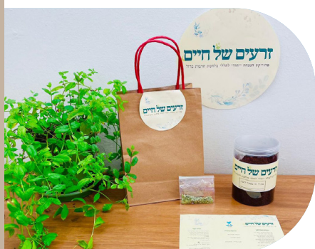
מארז מיוחד לט"ו בשבט לזכרם של הנופלים במלחמת חרבות