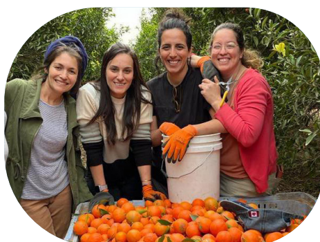
צוותי מכון סאמיט באומנה ובשיקום יצאו ליום קטיוף לסייע לחקלאי הדרום