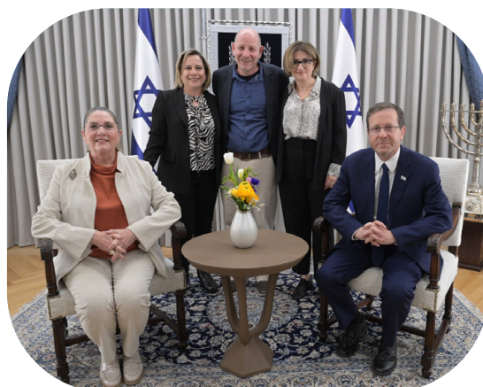
יום המשפחה 2023 בבית הנשיא עם בוגרים ומשפחות האומנה של מכון סאמיט