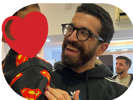
הזמר והיוצר חנן בן ארי - יקיר העמותה העניק לנו הופעה מרגשת באירוע בר מצווה וביקר באחת ממשפחות אומנת החירום