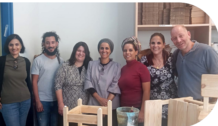
צוות המנהלה ביום התנדבות במפעל המוגן "יציר כפיים"