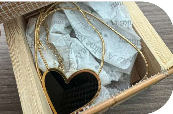
מאז ה-7/10 נשים בכל העולם עונדות את שרשרת האחדות שמאחדת אותנו ללב אחד ♥ את מכירת השרשרת יזמו יחידות סאמיט באוסטרליה וכל ההכנסות הינן קודש לטובת ילדי האומנה ומתמודדי עמותת מכון סאמיט.